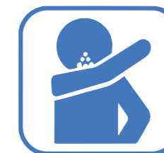
TOUSSER DANS SON COUDE