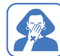
NE PAS TOUCHER LE VISAGE