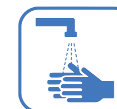
SE LAVÉ LES MAINS