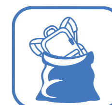
SAC À DOS DANS UN SAC